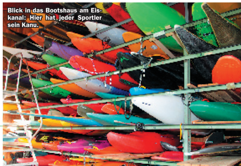
Blick in das Bootshaus am Eiskanal: Hier hat jeder Sportler sein Kanu.