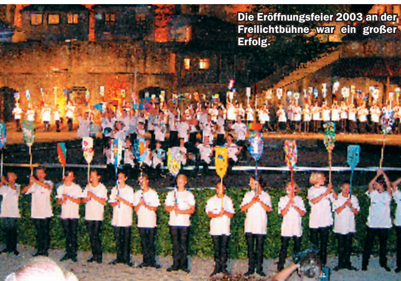
Die Eröffnungsfeier 2003 an der Freilichtbühne war ein großer Erfolg.

Und wie sieht die Zukunft aus? „Den Kanusport wird es in Augsburg auch weiterhin geben, aber mit welcher Qualität?“ stellt Englet in den Raum. Vor allem von der Stadt erhofft er sich finanzielle Unterstützung. Besonders die veralterte Infrastruktur am Eiskanal ist ihm ein Dorn im Auge. Wenn nicht investiert wird, drohe ein Verpassen des Anschlusses an weitere Kanu-Metropolen. Aber eins ist klar: Die Sportart ist in guten Händen.