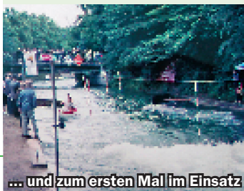
... und zum ersten Mal im Einsatz