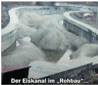
Der Eiskanal im „Rohbau“...

in Form, sowohl konditionell als auch technisch. Wer das Ticket für London bekommt, ist absolut nicht vorhersehbar.“ In vier Ausscheidungsrennen (zwei am Eiskanal, zwei in Markkleeberg, bei Leipzig) sollen dann die Ausgewählten herausfinden. Und die Vergangenheit zeigt: Wer sich da durchsetzt, hat gute Chancen auf den Griff zu Gold.